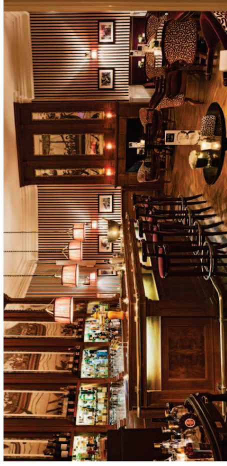
Bar Le 333 - Le Grand Hôtel Dinard