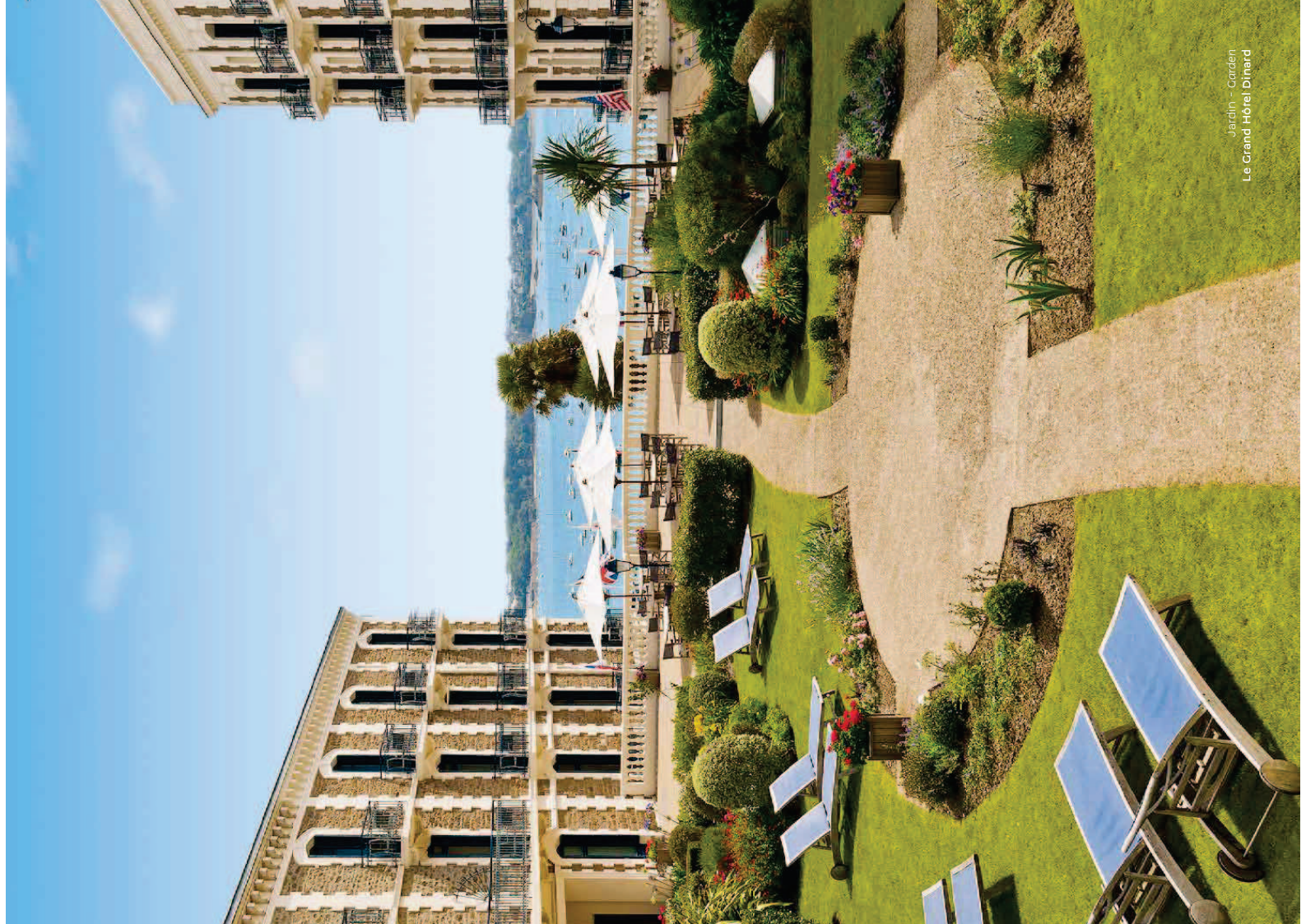
Jardin - Garden Le Grand Hôtel Dinard